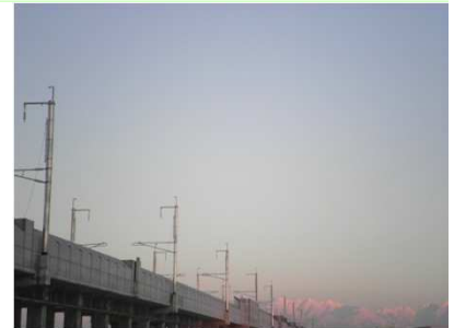
立山連峰と北陸新幹線

樹幹注入剤には薬剤散布にはない利点がありますが、使用方法を間違えると薬害が出るなどの弊害が起こります。大切な樹木を守るために、樹幹注入剤を使用する際は使用方法をよく確認した上で施工を行いましょう。