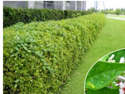
ヘクソカズラの花 (8月)

“ヘクソ”カズラという名の通り、全体に強い臭気があります。茎は長いつるになっており、他物に巻き付いて伸びていきます。葉のわきから出た枝先が細かく分かれ、7~9月ごろ、そこに花をつけます。その後、光沢がある黄褐色の果実となります。