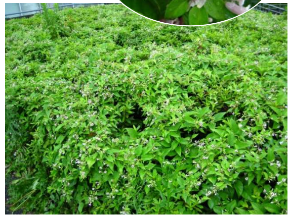
ヘクソカズラに覆われたツツジの植込み(8月)